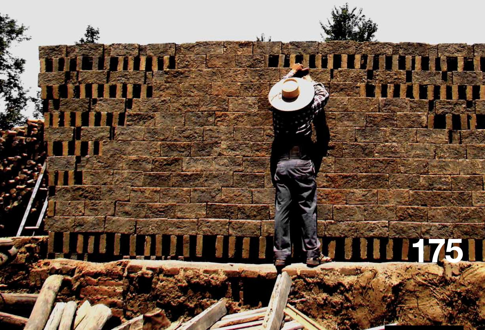
Imagen. Horno de Ladrillo Artesanal Invertido - Diego Parra