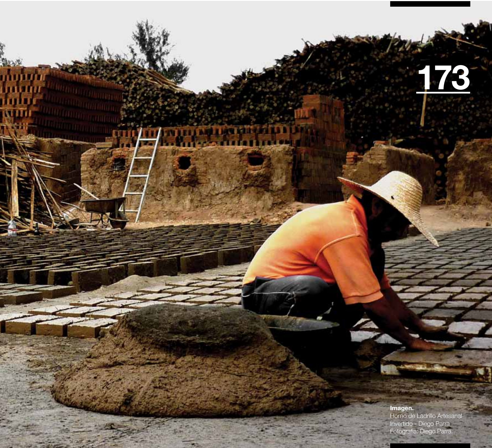
Imagen. Horno de Ladrillo Artesanal Invertido - Diego Parra.